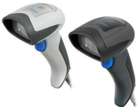
Snímač QR kódu DataLogic

Poté stiskneme tlačítko v nástrojové liště (menu: Export/Kombinované KP). Vybereme umístění a uložíme. V daném umístění bude uložen příslušný XML soubor.